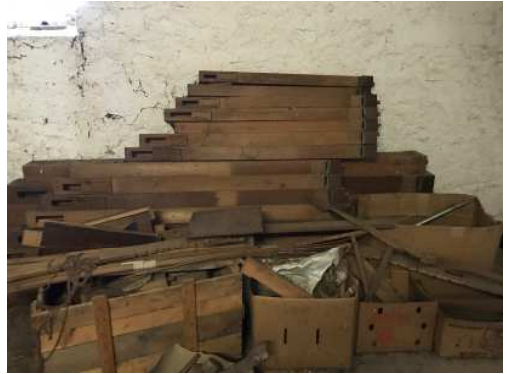
Holzpfеifen auf dem Kirchturm

Bilder: Die alte Orgel stand 100 Jahre in der Kirche- bis 1970. Es ist unwahrscheinlich, dass es keine Bilder gibt. Wir im Pfarramt haben aber keine und wissen somit auch nicht, wie die Orgel ausgesehen hat. Sie ist neugotisch gebaut, das war damals