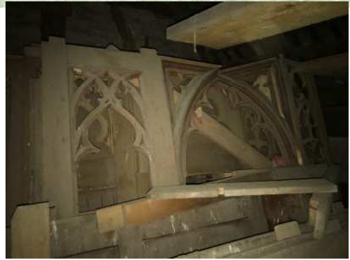
Gehäuse neugotisch 1870