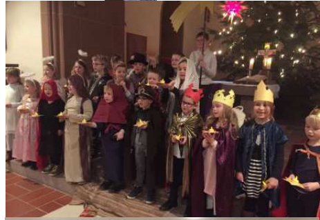
Krippenspiel an Heilig Abend