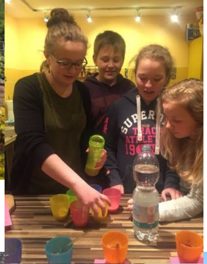
Jungchar und Teenkreis