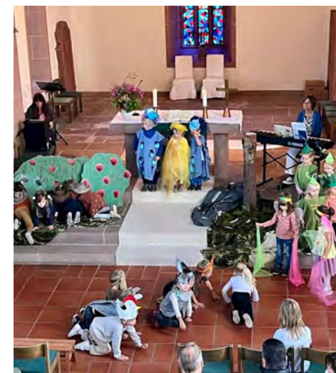
Oben: Viel zu entdecken für die kleinen Grabbenesch-Schatzsucher