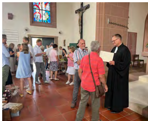
Im Gespräch mit der Gemeinde

das wahr ist, dass wir von Gott trotz und mit unserer Schuld angenommen und geliebt sind, dann bedeutet für mich, dass man als Christ sein darf, wie man ist. Wir müssen voreinander kein Theater spielen, was für tolle Christen wir seien. Und ich glaube, genau dadurch würden wir Christen in der Kirche auch für Menschen, die auf der Suche nach einem überzeugenden Glauben und einer tragfähigen Hoffnung sind, zu einem wichtigen Gegenüber im Gespräch über Gott und die Welt und die Bedeutung des Glaubens.