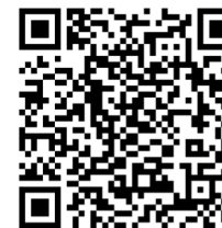
Spenden QR Code

Ihre Spende hilft in der Demokratischen Republik Kongo Zukunft zu ermöglichen. Bitte helfen Sie, dass noch mehr Menschen das bekommen, was sie zum Leben brauchen. Unterstützen Sie auch in diesem Jahr die Arbeit von „Brot für die Welt!“