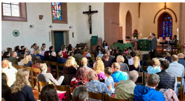
Links: Rappelvolle Marienkirche